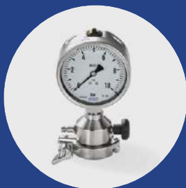
Ventilación TC 1.5" válvula + abrazadera

Lista completa de los accesorios y las piezas de repuesto disponibles bajo pedido.