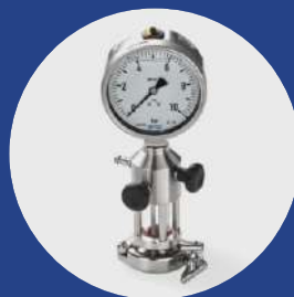
Ventilación TC 1.5" visor de vidrio 2 válvulas sanitarias + abrazadera