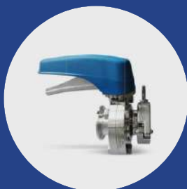
Válvula de mariposa TC + abrazadera