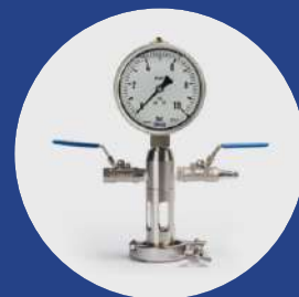
Ventilación TC 1.5" visor de vidrio 2 válvulas de esfera + abrazadera