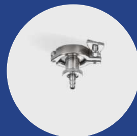
Ensayo de muestra TC 1.5" + abrazadera