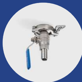
Válvula de esfera TC 1.5" + abrazadera